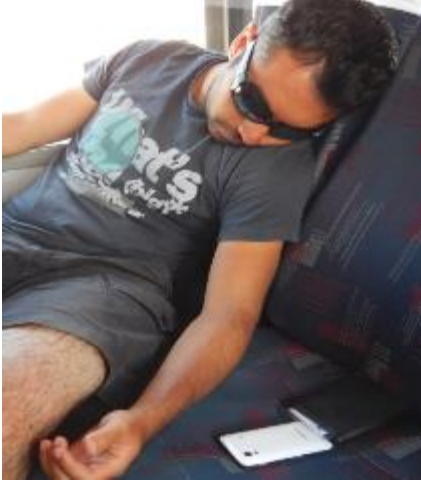
< UYKUCU ŞİRİNLER >

Taha'nın transa gitmeden bir maili vardı "arkadaşlar yataklara iyi davranalım lütfen" diye... sanırım davrandık ☺ 17.06.2014 sabahı şelalenin sesi ve odaya vuran güneş ışığı sayesinde uyandık ve tereyağı bal kaymak dolu kahvaltılı sofrasına oturduk. Kahvaltılı sonrası çantalarımız toparlayıp saat 11:45 gibi Yahyalı'ya varmak üzere pansiyonumuzdan ayrıldık. Yolda verdiğimiz molada aşık Akçakocalı'nın saz dinletisini dinledik. Yahyalı benzinliğe vardığımızda saatler 13:45'i gösteriyordu. Son bir otobüs değişimiyle saat 14:15'te benzinlikten Kayseri'ye doğru yola çıktık. Kayseri'ye vardığımızda yollarımız artık yavaş yavaş ayrılıyordu. Herkesin farklı saatte uçakları vardı ve havaalanı bizleri bekliyordu. Herkes gerçekten iyi yorulmuştu. İnanmazsanız işte kanıtı diyebileceğimiz iki arkadaşımızın fotoğrafı,